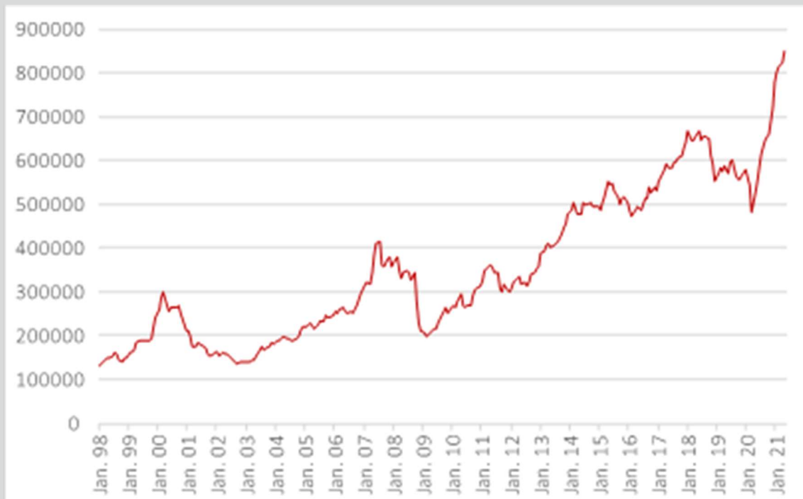
Abbildung 2: Wertpapierkredite in den USA (in Millionen US-Dollar)

Vermögen zu schützen. Ein weiterer Faktor sind die stark anziehenden Wertpapierkredite (zu Engl. margin debts). Diese sind seit der Krise um mehr als 350 Mrd. US-Dollar auf fast 850 Milliarden US-Dollar angestiegen (Vgl. Abbildung 2). Wertpapierkredite sind vorfinanzierte Aktienkäufe, die durch den Marktwert des Depots abgesichert werden. Vor den letzten beiden Krisen (2000 und 2008) befanden sich die Wertpapierkredite auch jeweils auf Rekordniveau.